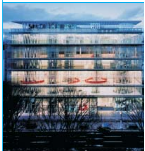
Médiathèque Sendai