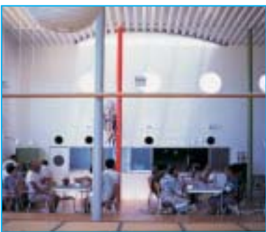
Maison de retraite à Yatsushiro