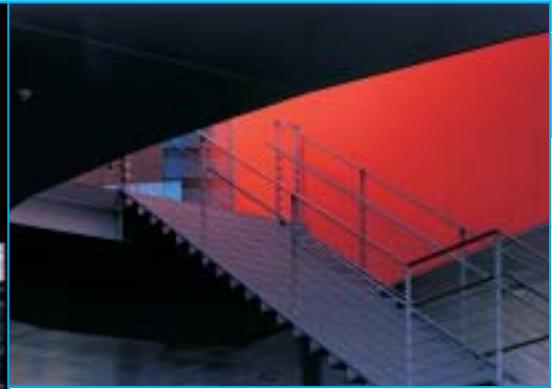
Caserne des pompiers

La durée de vie d'un bâtiment est supérieure à celle de l'usage pour lequel il est conçu, il doit dès lors permettre l'adaptation de l'espace afin de permettre d'autres utilisations. Prenons l'exemple de la Médiathèque de Sendai, dans laquelle extrêmement peu de cloisons fragmentent les vastes espaces intérieurs du bâtiment; l'espace de chaque niveau est grand ouvert et s'entremêle avec