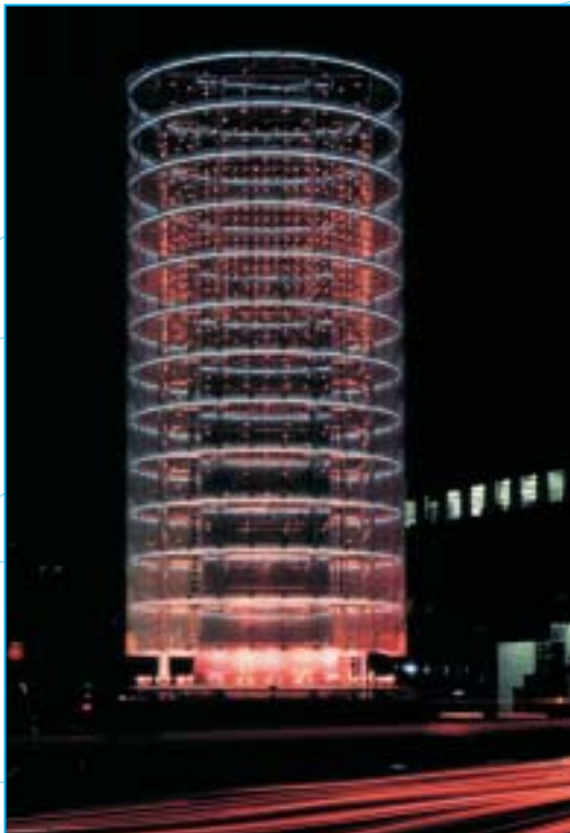
La Tour des Vents

Influent, bien que loin d'être un architecte prolifique, Toyo Ito met en place des stratégies minimalistes et développe une esthétique de légèreté, caractérisée par des enveloppes perméables pour abriter un mode de vie urbain "nomade", mobile et informel. La fascination de Toyo Ito pour la dimension éphémère de la ville "simulée", en constante métamorphose, marque ses œuvres d'un questionnement sur la nature de l'architecture. Il a conçu, et conçoit, des projets non seulement au Japon, mais aussi aux Etats-Unis et en Europe, où sera prochainement réalisé un pavillon sur la Grand Place de Bruges, Capitale européenne de la culture en 2002.