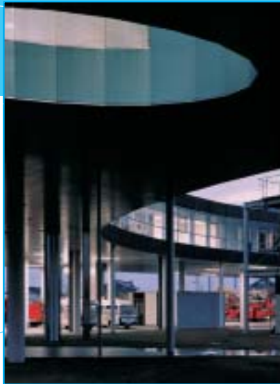
Caserne des pompiers © Naoya Yatakeyama

De la sorte, la Caserne des pompiers de Yatsushiro est constituée extérieurement par les reflets du métal et du verre et intérieurement par le blanc des parois, avec lesquels contrastent les orifices de